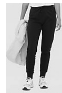
SOL'S JAKE WOMEN 02085